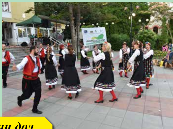
гр. Вълчи дол 07.07.2021 г.